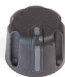
Стандартная кнопка регулировки

Разноцветные кольца помогают идентифицировать радиостанции для групп с различными задачами, зоной покрытия или сменами.